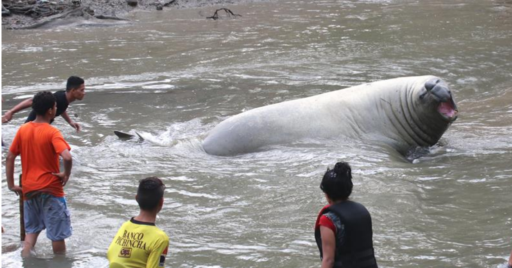
Figura 2. El animal rodeado por personas que lo forzaban a moverse río abajo. Figure 2. The animal surrounded by people being forced to move downstream.