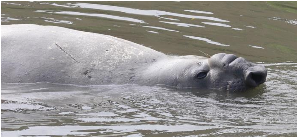
Figura 3. Forma de la probóscide típica de un macho adulto de elefante marino del sur. Nótese las cicatrices en el dorso atrás de la cabeza.